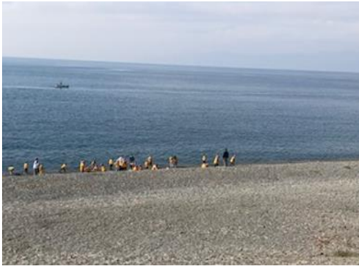
写真1 駿河湾で遊ぶ幼稚園児達