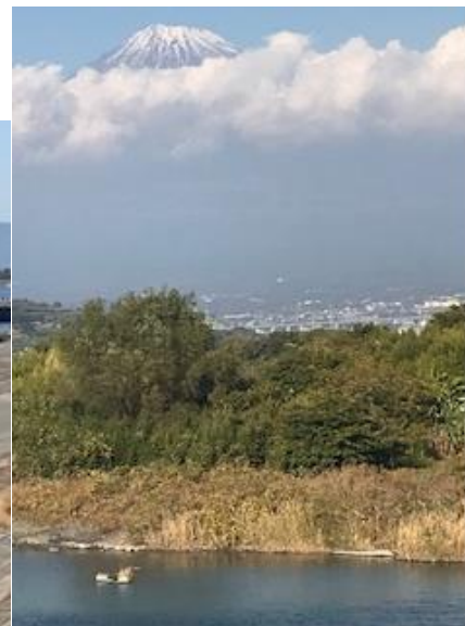
写真6 富士川からの富士の眺め