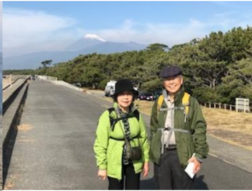
写真2 右前方には富士山がくっきり