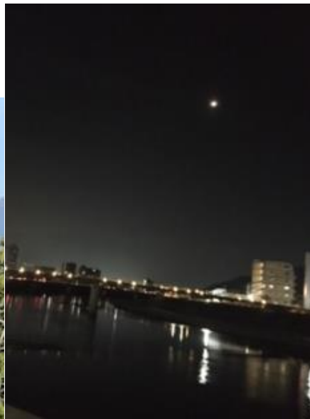
写真4 狩野川から見た皆既月食