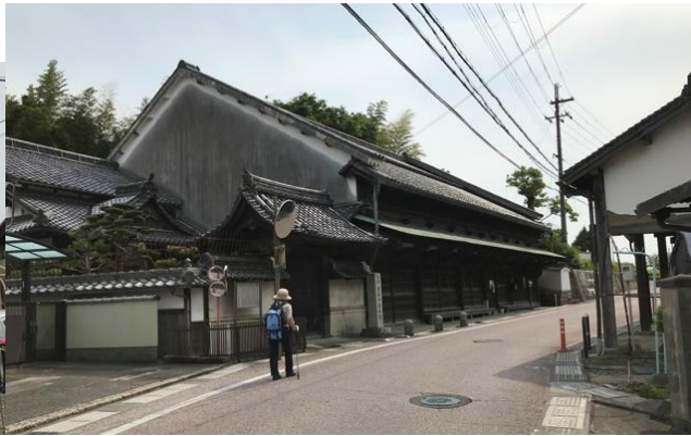
写真8 栗東市 史跡和中散本舗前 写真は幸子