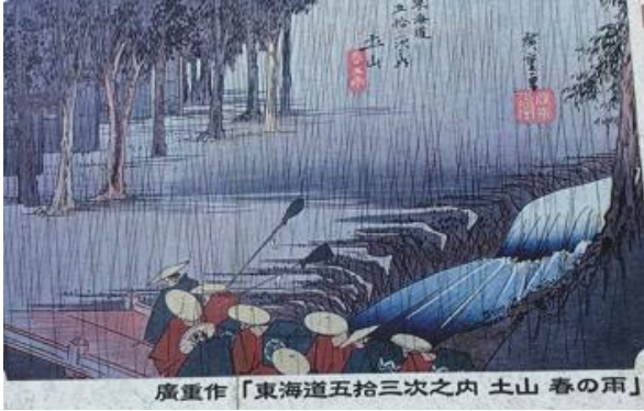
写真5 広重の土山春の雨