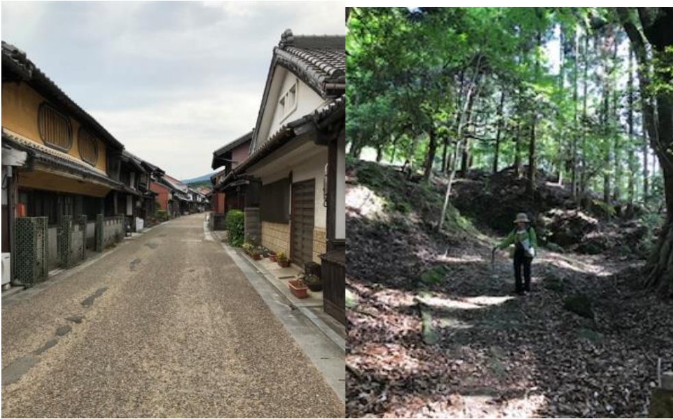
写真1 電柱がない関宿の街並み