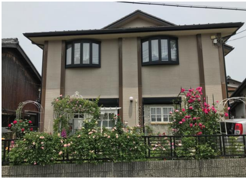
写真7 石部宿付近の民家 花が美しい